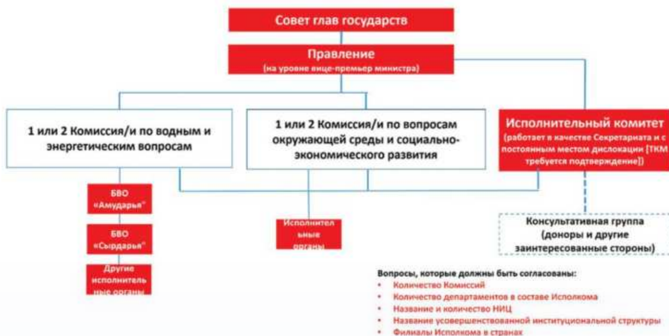
Рисунок 1. Возможная организационная структура, основанная на достигнутых договоренностях

По итогам обсуждений позицию делегации Кыргызской Республики не удалось интегрировать в возможную организационную структуру, которая отражает сближение позиций других сторон. Дальнейшее обсуждение по вопросу интегрирования и сближения позиций стран будет продолжено в ходе последующих заседаний РГ. Работа по Этапу 3 продолжается.